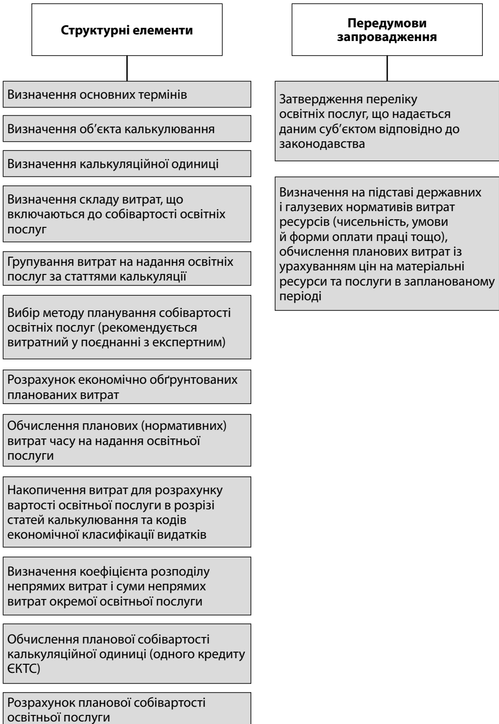
Рис. 1. Механізм формування собівартості освітніх послуг Складено авторами.