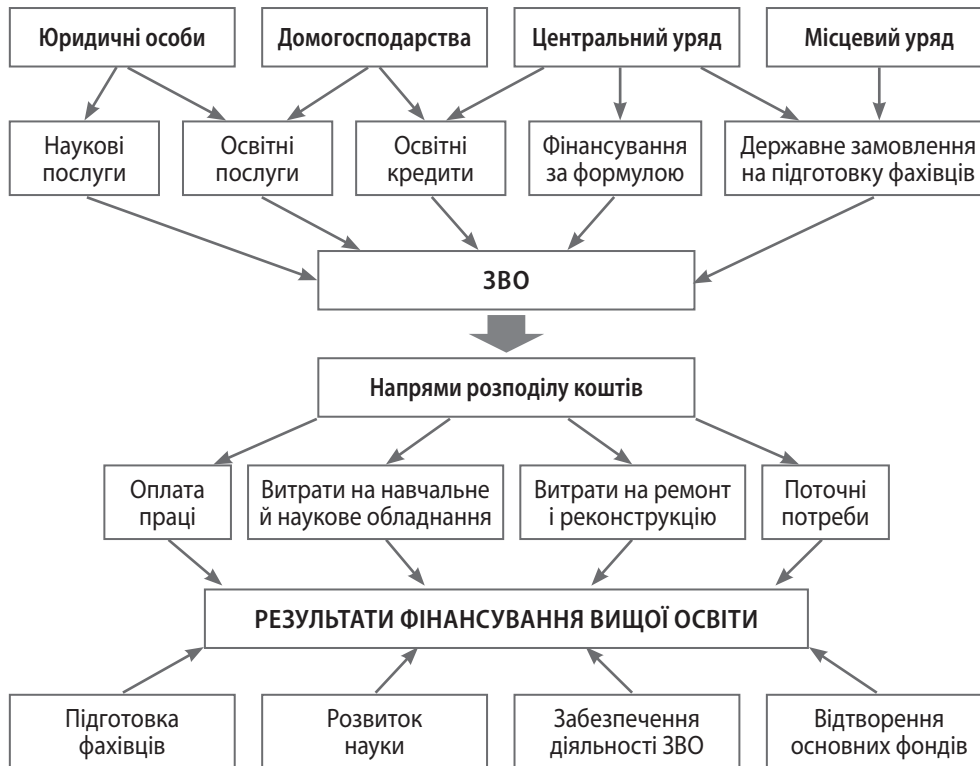
Рис. 2. Фінансування закладів вищої освіти за рахунок бюджетних та позабюджетних коштів