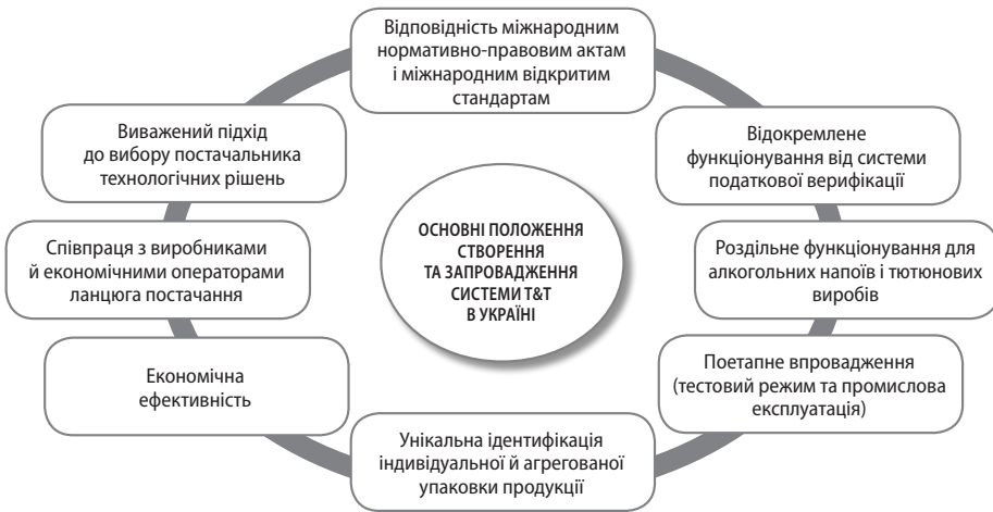
Рис. 2. Основні положення створення та запровадження системи T&T в Україні